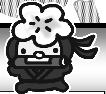
志木高校キャラクターこうちゃん